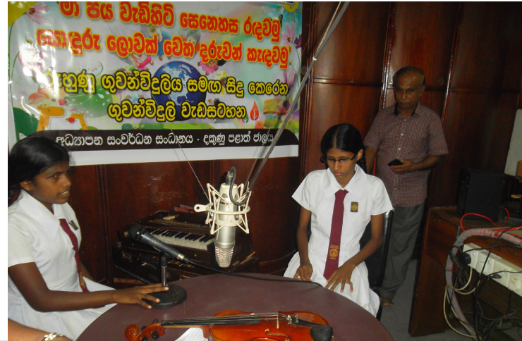
හබ් CED භෞමික පුවත් සඟරාව